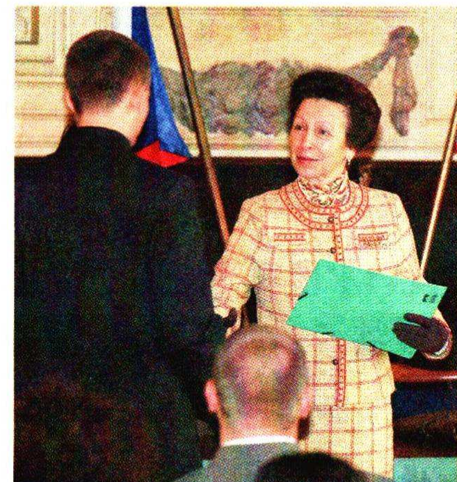
PRINCEZNA ANNA byla dalším členem britské královské rodiny, který přijel předávat ocenění za výsledky v programu.

Stříbrné ocenění si z úterního setkání odneslo i dalších